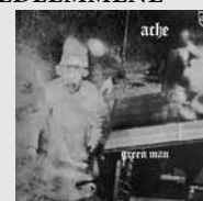
ACHE - Green Man Estoteric Records 2012 (Originalt 1971)